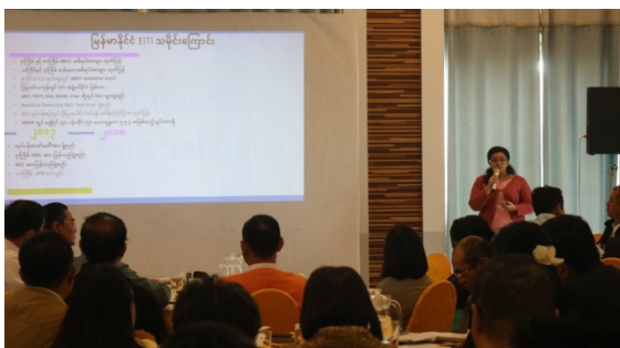
အကြီးတန်းပြန်ကြားရေးအရာရှိမှ တင်ပြစဉ်

မြန်မာနိုင်ငံ EITI ညှိနှိုင်းရေးမှူးရုံးမှ အကြီးတန်းပြန်ကြားရေးအရာရှိမှ မြန်မာနိုင်ငံ EITI သမိုင်းကြောင်းနှင့် ပြည်ထောင်စု အဆင့်တွင် မြန်မာနိုင်ငံ EITI လုပ်ငန်းစဉ်အား အဓိက ဦးဆောင်နေသူများအကြောင်း၊ EITI လုပ်ငန်းစဉ်သည် နိုင်ငံတော်အဆင့် စီမံကိန်းတစ်ခုဖြစ်သည့် မြန်မာနိုင်ငံ ၏ ရေရှည်တည်တံ့ခိုင်မြဲပြီး ဟန်ချက်ညီသော ဖွံ့ဖြိုးတိုးတက်မှု စီမံကိန်းနှင့် ချိတ်ဆက် နေပုံ၊ ထုတ်ပြန်ထားသည့် မြန်မာနိုင်ငံ EITI အစီရင်ခံစာများ၏ လွှမ်းခြုံမှုများအပြင် Mining Cadastre အပါအဝင် ဆောင်ရွက်ဆဲ မြန်မာနိုင်ငံ EITI လုပ်ငန်းစဉ်များ၊ မြန်မာနိုင်ငံ EITI အကဲဖြတ်ဆန်းစစ် အတည်ပြုခြင်း ရလဒ်နှင့် ပြုပြင် ဆောင်ရွက်ရမည့်အချက် (၁၂) ချက်တို့အား ရှင်းလင်းတင်ပြခဲ့ပါသည်။ ထို့နောက် အကျိုးအမြတ်ရရှိပိုင်ဆိုင်မှု ညှိနှိုင်းရေးမှူးမှ အကျိုးအမြတ် ရရှိပိုင်ဆိုင်မှု ဖော်ဆောင်ရေးလုပ်ငန်းစဉ်အတွက် မြန်မာနိုင်ငံ၏ ကြိုးပမ်း အကောင်အထည် ဖော်ဆောင်ထားမှုများ၊ သမ္မတရုံးအမိန့် ကြော်ငြာစာ ထွက်ရှိထားပုံများ၊ BO Online Template ပုံစံများအား ရှင်းလင်း တင်ပြခဲ့ပါသည်။