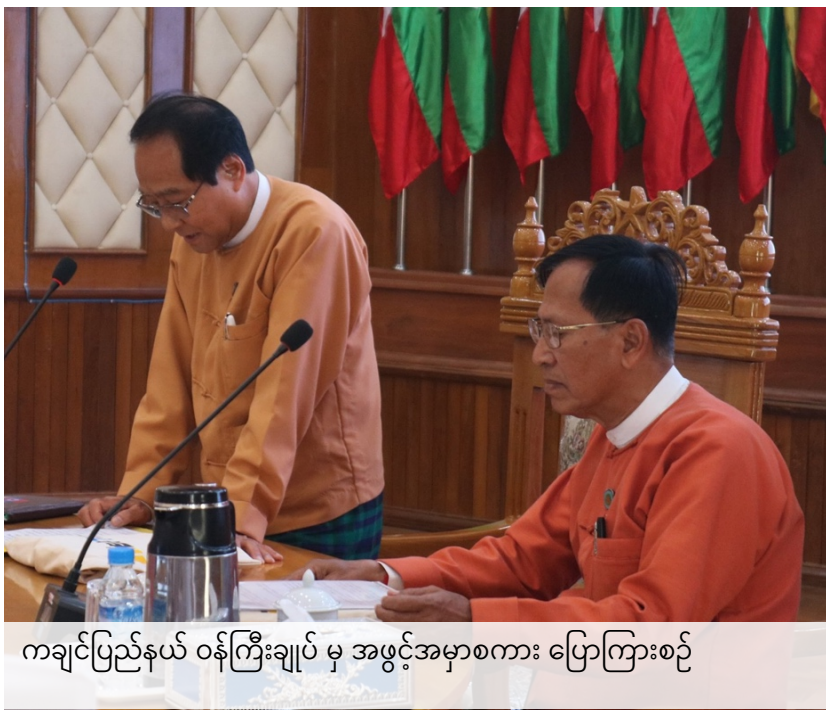
ကချင်ပြည်နယ် ဝန်ကြီးချုပ် မှ အဖွင့်အမှာစကား ပြောကြားစဉ်

၂၀၂၀ ပြည့်နှစ်၊ ဖေဖော်ဝါရီလ (၇) ရက်နေ့ကျင်းပခဲ့သည့် ကချင်ပြည်နယ်၊ မြစ်ကြီးနားမြို့၊ အစိုးရအဖွဲ့ရုံးတွင် EITI စံနှုန်းနှင့် မြန်မာနိုင်ငံ EITI လုပ်ငန်းစဉ်များအား မိတ်ဆက်ရှင်းလင်းတင်ပြခြင်းအခမ်းအနားတွင် ကချင်ပြည်နယ်ဝန်ကြီးချုပ်မှ အဖွင့်မိန့်ခွန်းပြောကြား ရာတွင် ကချင်ပြည်နယ်ဟာ ခါကာဘိုရာဇီ၊ ဂန်လန်ရာဇီ၊ ဖုန်ကန်ရာဇီ၊ မဒွယ်ရာဇီတောင်တန်းများ၊ ဟူးကောင်းမြေပြန့်လွင်ပြင်၊ မိုးကောင်းမြေပြန့်လွင်ပြင်၊ မေခ၊ မလိခမြစ်၊ ဧရာဝတီမြစ် စသည့် မြစ်များစီးဆင်းပြီး သစ်တော ဖုံးလွှမ်းသောဧရိယာ ၇၃.၄၅ ရာခိုင်နှုန်းရှိကာ ကမ္ဘာကျော် ကျောက်စိမ်း ထွက်ရှိရာ ဒေသဖြစ်သည့်အပြင် သယံဇာတပေါကြွယ်ဝသည့် ဒေသလည်းဖြစ်ကြောင်း၊