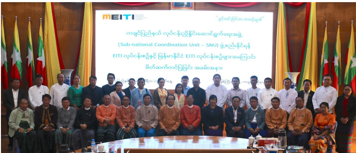
မိတ်ဆက်တင်ပြခြင်းအခမ်းအနား တက်ရောက်လာသူများ မှတ်တမ်းတင်ဓါတ်ပုံရိုက်ကူးစဉ်

ထို့နောက် တက်ရောက်သူများအား မှတ်တမ်းတင်ဓါတ်ပုံများ ရိုက်ကူးကာ အခမ်းအနားအား အောင်မြင်စွာ ကျင်းပခဲ့ကြပါသည်။