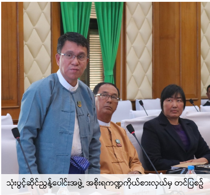
သုံးပွင့်ဆိုင်ညွှန်ပေါင်းအဖွဲ့ အစိုးရကဏ္ဍကိုယ်စားလှယ်မှ တင်ပြစဉ်

အစီရင်ခံစာများတိုင်းတွင် အစီရင်ခံစာအား ရေးသား ပြုစုသည့် လွတ်လပ်သော စာရင်းတိုက်ဆိုင်သူ (Independent Administrator - IA) မှ ပေးထားသည့် အကြံပြုတိုက်တွန်းချက် များ ပါဝင်ကြောင်း၊ ယင်းအကြံပြုတိုက်တွန်းချက်များသည် အစိုးရအတွက် သယံဇာတကဏ္ဍအား စီမံခန့်ခွဲမှု ပိုမိုပြုပြင်ကောင်းမွန်စေရန် အကြံပြုထားခြင်းဖြစ်ကြောင်း၊ ဝန်ကြီးဌာနအတွက် လိုက်လျောညီထွေစွာ ပြုပြင်ပြောင်းလဲခံရသည်များရှိကြောင်း၊ ယင်းသည် အပြုသဘောဆောင် သည့် ပြုပြင်ဆောင်ရွက်ခြင်းဖြစ်ကြောင်း၊ ဥပမာ - ဝန်ကြီးဌာနဝက်ဘ်ဆိုက်များအား ပုံမှန် Update ပြုလုပ်လာပြီး လိုင်စင်လျှောက်ထားမှုအချက်အလက်များအား အများပြည်သူများ လက်လှမ်းမှီ