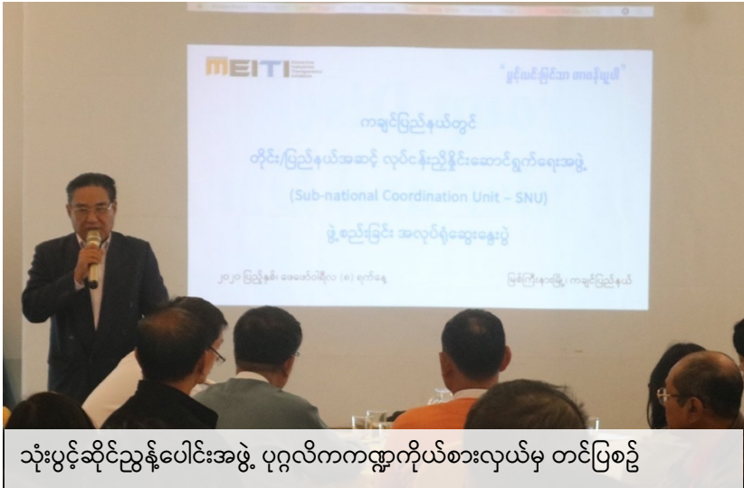
သုံးပွင့်ဆိုင်ညွှန်ပေါင်းအဖွဲ့ ပုဂ္ဂလိကကဏ္ဍကိုယ်စားလှယ်မှ တင်ပြစဉ်

ကုမ္ပဏီများ အားလည်း ထဲထဲဝင်ဝင် ပါဝင် ပတ်သက်ရန် လိုအပ် ကြောင်း၊ ထိုသို့ ပူးပေါင်း ဆောင်ရွက်ခြင်းဖြင့် မိမိတို့ ကုမ္ပဏီအကျိုးများ နိုင် ကြောင်း၊ နိုင်ငံခြား ကုမ္ပဏီ တစ်ခုက မိမိကုမ္ပဏီနှင့် ပူးပေါင်းလို ပါက မိမိသည်