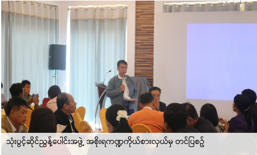
သုံးပွင့်ဆိုင်ညွှန်ပေါင်းအဖွဲ့ အစိုးရကဏ္ဍကိုယ်စားလှယ်မှ တင်ပြစဉ်

EITI သည် ပြည်ထောင်စုမှ ချမှတ်ထားသည့် Commitment ဖြစ်သည့် အတွက် လိုက်ပါဆောင်ရွက်ရန် လိုအပ်ကြောင်း၊ စဉ်ဆက်မပြတ်ပါဝင် တာဝန်ယူရန် လိုအပ်ကြောင်း ၊ ကချင်ပြည်နယ်တွင် အဓိကမှာ