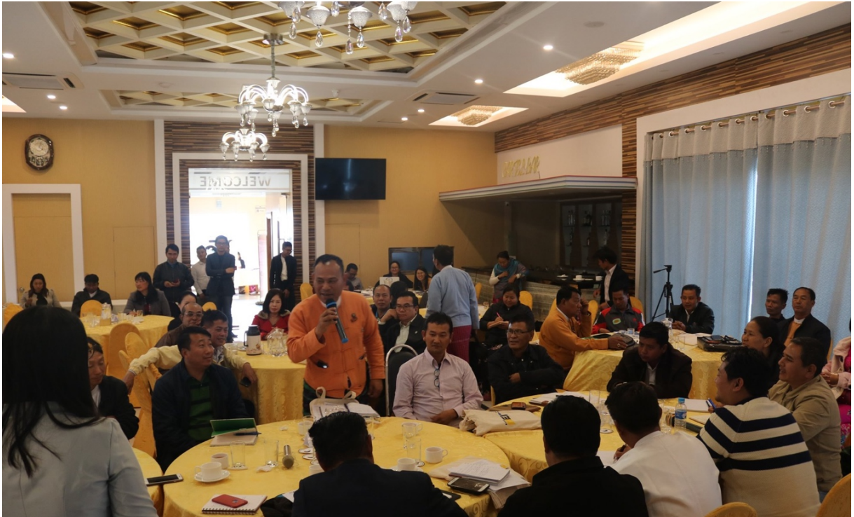
နာယကမှ ဦးဆောင်၍ ဆက်လက်ဆောင်ရွက်ကြရမည့် ရှေ့လုပ်ငန်းစဉ်များ ဆွေးနွေးစဉ်