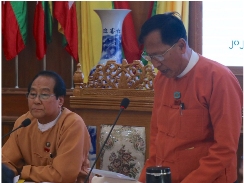
ကချင်ပြည်နယ် လွှတ်တော်ဥက္ကဋ္ဌ မှ အဖွင့်အမှာစကား ပြောကြားစဉ်

မိမိတို့နိုင်ငံသည် ကျောက်စိမ်း၊ သတ္တု၊ သစ်၊ ရေနံ၊သဘာဝဓါတ်ငွေ့ အစရှိသည့် သယံဇာတပစ္စည်းများ ပေါကြွယ်ဝသည့် နိုင်ငံဖြစ်ပြီး မိမိတို့ကချင်ပြည်နယ်သည် သယံဇာတ ပေါကြွယ်ဝသည့် ဒေသတစ်ခုလည်း ဖြစ်ပါကြောင်း၊ သယံဇာတ ပေါကြွယ်ဝသည့် နိုင်ငံအနေဖြင့် EITI စံနှုန်းများဖြစ်သည့်