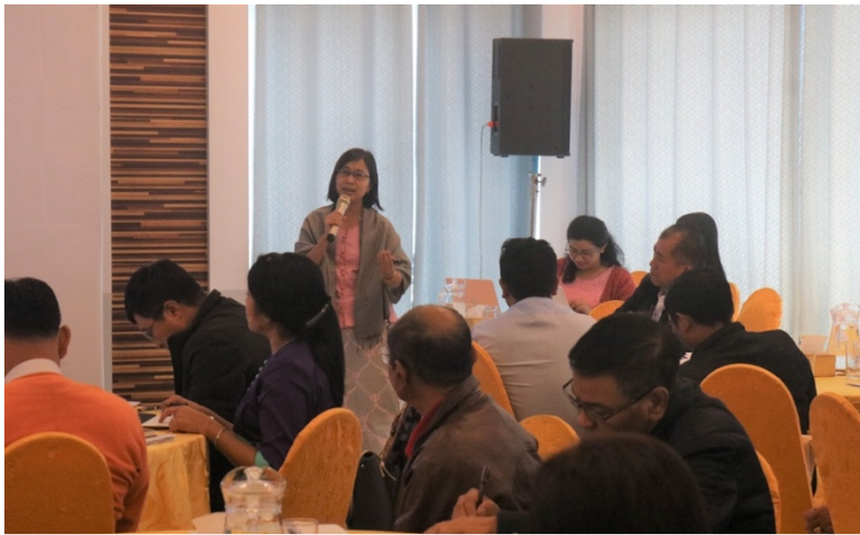
သုံးပွင့်ဆိုင်ညွှန်ပေါင်းအဖွဲ့ အရပ်ဘက်ကဏ္ဍကိုယ်စားလှယ်မှ တင်ပြစဉ်

SNU ၏ Term of Reference မဖော်ပြထားသည့် သုံးပွင့်ဆိုင်ညွှန်ပေါင်းအဖွဲ့၏ အခြေခံမူအပိုဒ် (၄) အားရင်းလင်းတင်ပြရာတွင် ပွင့်လင်းမြင်သာမှု၊ တာဝန်ယူမှု တာဝန်ခံမှု၊ ဖြောင့်မတ်မှန်ကန်မှု၊ နိုင်ငံအကျိုးစီးပွားကို ရှေ့ရှုမှု၊ တိုင်းရင်းသားပြည်သူများ၏ သဘောထားနှင့် အကျိုးစီးပွားကို အလေးထားမှု၊ စဉ်ဆက်မပြတ်ဖွံ့ဖြိုးတိုးတက်မှု၊ လွတ်လပ်စွာကြိုတင်အသိပေးညှိနှိုင်းရယူထားသည့် သဘောတူညီချက်၊ စစ်မှန်သောပါဝင်မှုနှင့် အားလုံးအကျိုးဝင်မှုတို့သည် လေးစားလိုက်နာကျင့်သုံးရမည့် အချက်များဖြစ်ကြောင်း၊ သုံးပွင့်ဆိုင်ညွှန်ပေါင်းအဖွဲ့၏ တာဝန်နှင့်ဝတ္တရားများဖြစ်သည့် ပူးပေါင်းဆောင်ရွက်ခြင်း၊ ပြည်သူများ၏ စွမ်းဆောင်ရည်ကိုမြှင့်တင်ခြင်း၊ အစီရင်ခံစာပါ အချက်အလက်များကို အများပြည်သူသို့ အချိန်မီ ထုတ်ပြန်နိုင်ရေး၊ MATA အနေဖြင့် အဓိကဆောင်ရွက်ရသည့် အချက်တစ်ချက်ဖြစ်သည့် သုံးပွင့်ဆိုင်ညွှန်ပေါင်းအဖွဲ့မှ သဘောတူအတည်ပြုထားသော သတင်းအချက်အလက်များ အရပ်ဘက်အဖွဲ့အစည်းများနှင့် ပြည်သူများ အတွင်းသိရှိနားလည်ရေးနှင့် လက်တွေ့အကောင်အထည်ဖော်နိုင်ရေးအတွက် တာဝန်ယူဆောင်ရွက်ခြင်း၊ EITI လုပ်ငန်းစဉ်ကို အတားအဆီးဖြစ်စေသော ကိစ္စရပ်များကို သုံးပွင့်ဆိုင်ညွှန်ပေါင်းအဖွဲ့နှင့် ညှိနှိုင်းအဖြေရှာပြီး အောင်မြင်စွာ အကောင်အထည်ဖော် ဆောင်ရွက်ခြင်းများအား SNU များအနေဖြင့် လေးစားလိုက်နာရမည် ဖြစ်ကြောင်း၊ EITI သည် လုပ်ငန်းစဉ်ဖြစ်သည့်အလျောက် လုပ်ငန်းစဉ် အား ရပ်တန့်၍