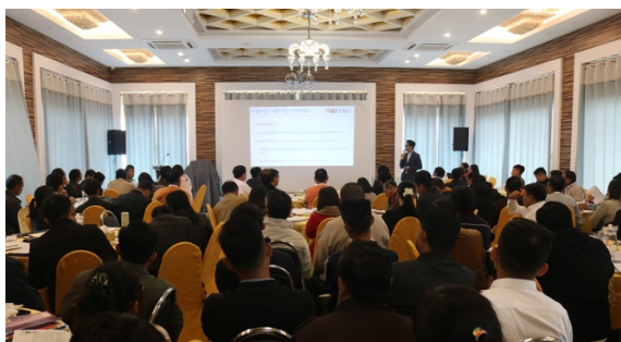
အကျိုးအမြတ်ရရှိပိုင်ဆိုင်မှုညှိနှိုင်းရေးမှူးမှ တင်ပြစဉ်

မြန်မာနိုင်ငံ EITI ညှိနှိုင်းရေးမှူးရုံးမှ တင်ပြမှုအပြီးတွင် တက်ရောက်သူတစ်ဦးမှ မန္တလေးတိုင်း ဒေသကြီးသို့ သွားရောက်လမ်းတစ်လျှောက်တွင် Infrastructure နှင့် Building Industry အတွက် လုပ်ဆောင်နေသည်များ ရှိကြောင်း၊ Mining ကဏ္ဍတွင် နောက်တွင်ပါဝင်လာရန် ရှိပါသလားဟု