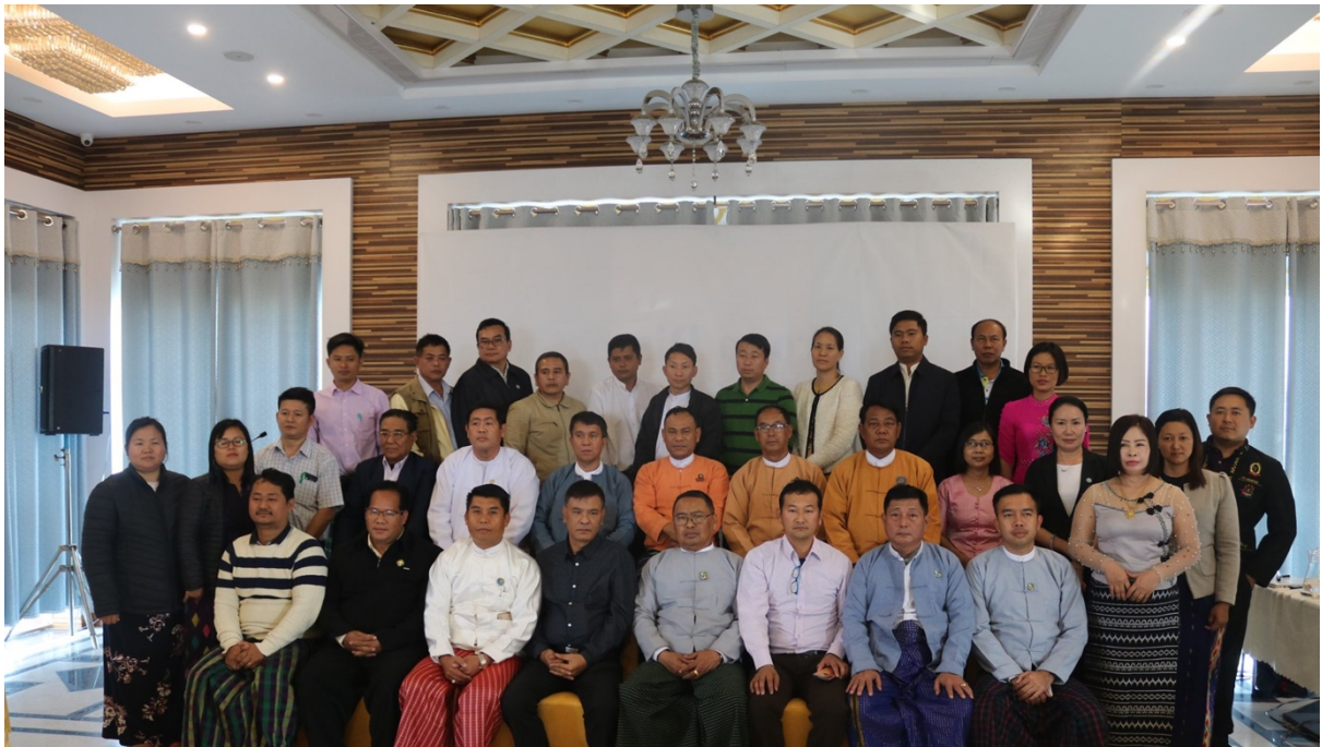
သုံးပွင့်ဆိုင်ညွန့်ပေါင်းအဖွဲ့ကိုယ်စားလှယ်များ၊ ကချင်ပြည်နယ် SNU မှ နာယက၊ အတွင်းရေးမှူးများ၊ အဖွဲ့ဝင်များနှင့် အရန်ကိုယ်စားလှယ်များ မှတ်တမ်းဓာတ်ပုံရိုက်ကူးစဉ်

Cadastre အား ချိတ်ဆက်ဆောင်ရွက်နေသည်ဟု သိရှိထားကြောင်း၊ ပြည်ထောင်စုအဆင့် Mining Cadastre နှင့် ချိတ်ဆက်ပါက ပိုမိုအကျိုးရရှိမည်ဖြစ်ကြောင်း၊ SNU ဦးစားပေးလုပ်ငန်းများတွင် အကျိုးအမြတ်ရရှိပိုင်ဆိုင်မှုဖော်ထုတ်ခြင်း၊ နိုင်ငံတော်ပိုင်စီးပွားရေးအဖွဲ့အစည်းများ ပြုပြင်ပြောင်းလဲခြင်းများ၊ သတ္တုကဏ္ဍဗဟိုချုပ်ကိုင်မှု လျော့ချခြင်းများအား ထည့်သွင်းနိုင်ကြောင်း၊ မူဝါဒအားဖြင့် ကချင်ပြည်နယ်တွင် ကျောက်စိမ်းကျောက်မျက်မူဝါဒအတွက် လူထုနှင့်တွေ့ဆုံဆွေးနွေးပွဲများ ဆောင်ရွက်ထားပြီး ဖြစ်ကြောင်း၊ ဆက်လက်အကောင်အထည်ဖော်နိုင်ရန် SNU မှတိုက်တွန်းအားပေးနိုင်ကြောင်း၊ ဓာတ်သတ္တုမူဝါဒပိုင်းအတွက်လည်း ပြည်ထောင်စုအဆင့်နှင့် ချိတ်ဆက်၍ SNU မှ ဆောင်ရွက်ရန် တိုက်တွန်းလိုပါကြောင်း ရှင်းလင်းပြောကြားခဲ့ပါသည်။