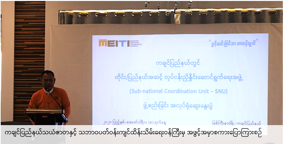
ကချင်ပြည်နယ်သယံဇာတနှင့် သဘာဝပတ်ဝန်းကျင်ထိန်းသိမ်းရေးဝန်ကြီးမှ အဖွင့်အမှာစကားပြောကြားစဉ်

ကချင်ပြည်နယ် သယံဇာတနှင့် သဘာဝပတ်ဝန်းကျင်ထိန်းသိမ်းရေးဝန်ကြီးမှ အဖွင့်အမှာစကားပြောကြားရာတွင် ကချင်ပြည်နယ်သည် (၁၈) မြို့နယ်လုံးတွင် သယံဇာတများ ပေါကြွယ်ဝကြောင်း၊ သယံဇာတထုတ်ယူသုံးစွဲမှုပိုင်းတွင် ပွင့်လင်းမြင်သာမှု အားနည်းသည့်အပိုင်းများ ရှိကြောင်း၊ ထုတ်ယူသူနှင့် ခွင့်ပြုမိန့်ချပေးသူများအကြား သဟဇာတဖြစ်မှု အားနည်းသည်ကို အားမရဖြစ်ရပါကြောင်း၊ ကချင်ပြည်နယ်တွင်း သယံဇာတလုပ်ငန်းသုံးစွဲမှုနှင့် ပတ်သက်သည့် ကိစ္စရပ်များတွင် မိမိတို့ကိုယ်စွမ်းဉာဏ်စွမ်းရှိသမျှ ပြည်သူများနှင့် ဆွေးနွေးမှုများ လုပ်ဆောင်ခဲ့ကြောင်း၊ သယံဇာတမှီဝဲနေသည့် ပြည်နယ်အနေဖြင့် SNU လုပ်ငန်းစဉ်တွင် ပူးပေါင်းပါဝင်ရန် အခွင့်ကြုံလာသည့်အတွက် ဝမ်းမြောက်ရပါကြောင်း၊ သယံဇာတထုတ်ယူသုံးစွဲမှုအပိုင်းတွင် များစွာ အထောက်အကူပြုမည်ဟု မျှော်မှန်းကြောင်း၊ ကြားခံအဖွဲ့တစ်ခုရှိလာပြီ ဖြစ်သဖြင့် လုပ်ဆောင်နေသည့်လုပ်ငန်းစဉ်များတွင် ကြုံတွေ့ရသည့် အခက်အခဲများ၊ ပွင့်လင်းမြင်သာမှုအားနည်းမှု ကြုံတွေ့နေရခြင်းများအား အစိုးရ၊ လုပ်ငန်းရှင်များ၊ ပြည်သူများအကြား ညှိနှိုင်းဆောင်ရွက်နိုင်မည်ဖြစ်ကြောင်း၊ ဖွဲ့စည်းပြီးနောက်ပိုင်း ကိုယ်ရောစိတ်ပါ ပါဝင်ပေးရန် မေတ္တာရပ်ခံတိုက်တွန်းကြောင်း၊ SNU ၏ ရည်ရွယ်ချက်နှင့် လုပ်ငန်းတာဝန်များအား ပုံမှန် လုပ်ဆောင်နေမှသာလျှင် ဖြစ်ပေါ်လာမည့် အခက်အခဲများအား ဆွေးနွေးညှိနှိုင်းခြင်းအားဖြင့် ရလဒ်ကောင်းများ ရရှိလာမည် ဖြစ်ကြောင်း၊ အလုပ်ရုံဆွေးနွေးပွဲတွင် အင်တိုက်အားတိုက် ပါဝင်ဆွေးနွေးပါရန် ပြောကြားခဲ့ပါသည်။