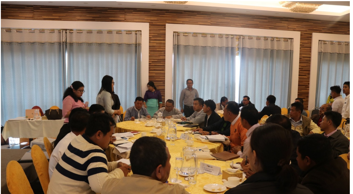
နာယကမှ ဦးဆောင် ၍ သုံးပွင့်ဆိုင်ညွှန်ပေါင်းအဖွဲ့၊ ကချင်ပြည်နယ် SNU အဖွဲ့၊ MOBD နှင့် မြန်မာနိုင်ငံ EITI ညှိနှိုင်းရေးမှူးရုံး တာဝန်ဝန်ရှိသူများသည် ဆက်လက်ဆောင်ရွက်ကြရမည့် ရှေ့လုပ်ငန်းစဉ်များ ဆွေးနွေးစဉ်